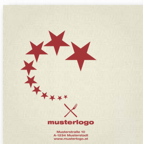
1/4 Falz, Ihr Logo + Illustration