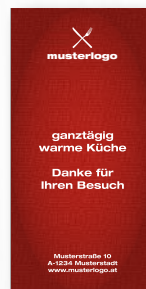
1/8 Falz, Ihr Logo + Wunschtext + Adresse