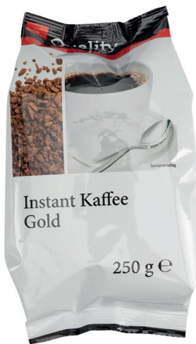
QUALITY – INSTANTKAFFEE kräftig für Automaten

Instantprodukte erfreuen sich auf dem Heißgetränkemarkt einer großen Popularität, und auch die Vorteile eines löslichen Getränks werden in einer schnelllebigen Zeit immer bedeutender. Beim hohen Stellenwert der österreichischen Kaffeekultur zählt natürlich auch bei Instantprodukten ein hervorragendes Aroma.