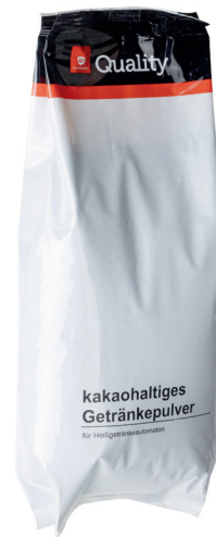
QUALITY – KAKAO MIX 16% für Automaten