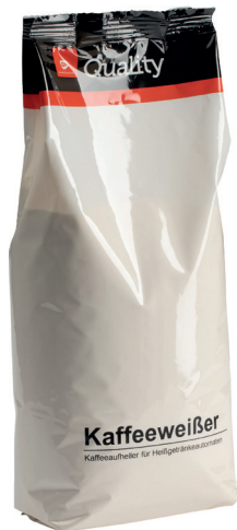
QUALITY – KAFFEEWEISSER kräftig für Automaten