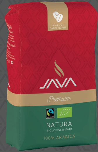
JAVA Natura biologisch fair 1 kg Art. Nr. 3157294